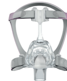
Mirage FX for Her van Resmed