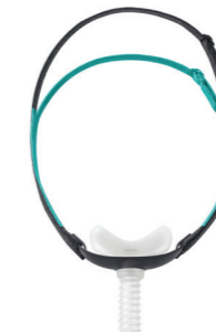
Therapy Mask 3100 NC van Philips