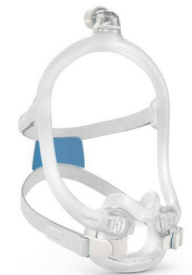
F30i van Resmed