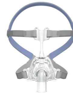
Mirage FX van Resmed