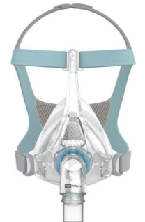
Vitera van Fisher & Paykel