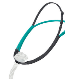
Therapy Mask 3100 SP van Philips